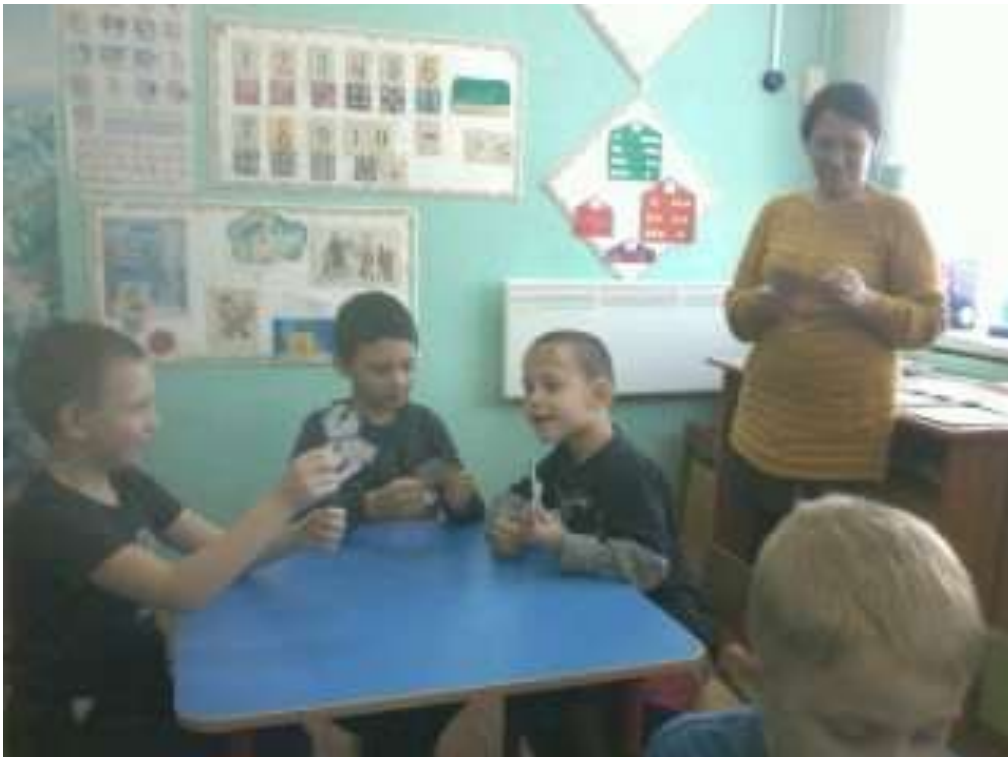
Малыши получили подарки. Они делятся впечатлениями.