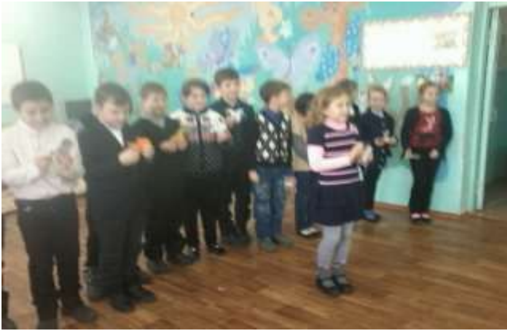
Ребята в старшей группе детского сада.