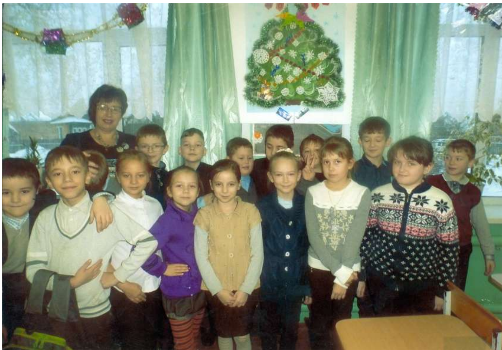
Итогом проекта стали дела класса, отраженные на данном дереве.